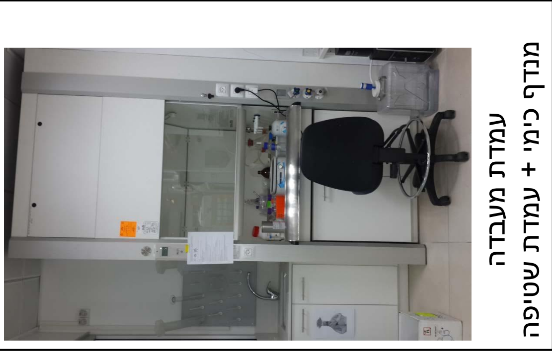
עמדת מעבדה מנדף כימי + עמדת שטיפה